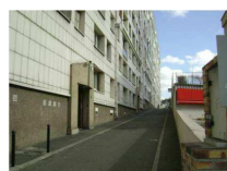
L'immeuble du 190 et la rampe d'accès