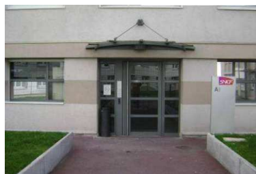
Entrée du bâtiment A