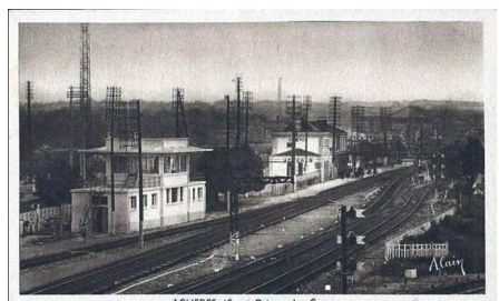
ACHERES (S.-et-O.) — La Gare