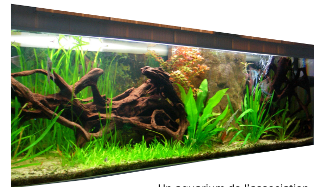
Un aquarium de l'association

L' aquarium, le terrarium, un peu de la nature dans votre salon